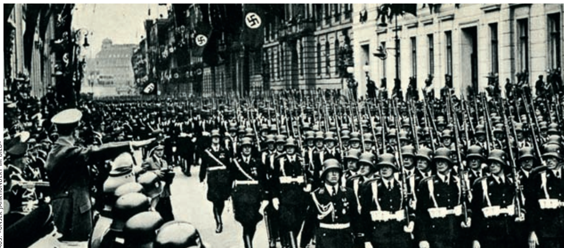
Vorbeimarsch der SS-Leibstandarte: Parade in der Wilhelmstrasse zu Hitlers 50. Geburtstag am 20. April 1939.

Es ist ein Warn- und Mahnruf an kommende Generationen, Mehrheitsmeinungen und Machtpolitik zu hinterfragen, leere Versprechungen als solche zu entlarven und sich die Hirne nie wieder «vernebeln und verdunkeln» zu lassen, wie Kellner es ausdrückt. Sein Einsatz